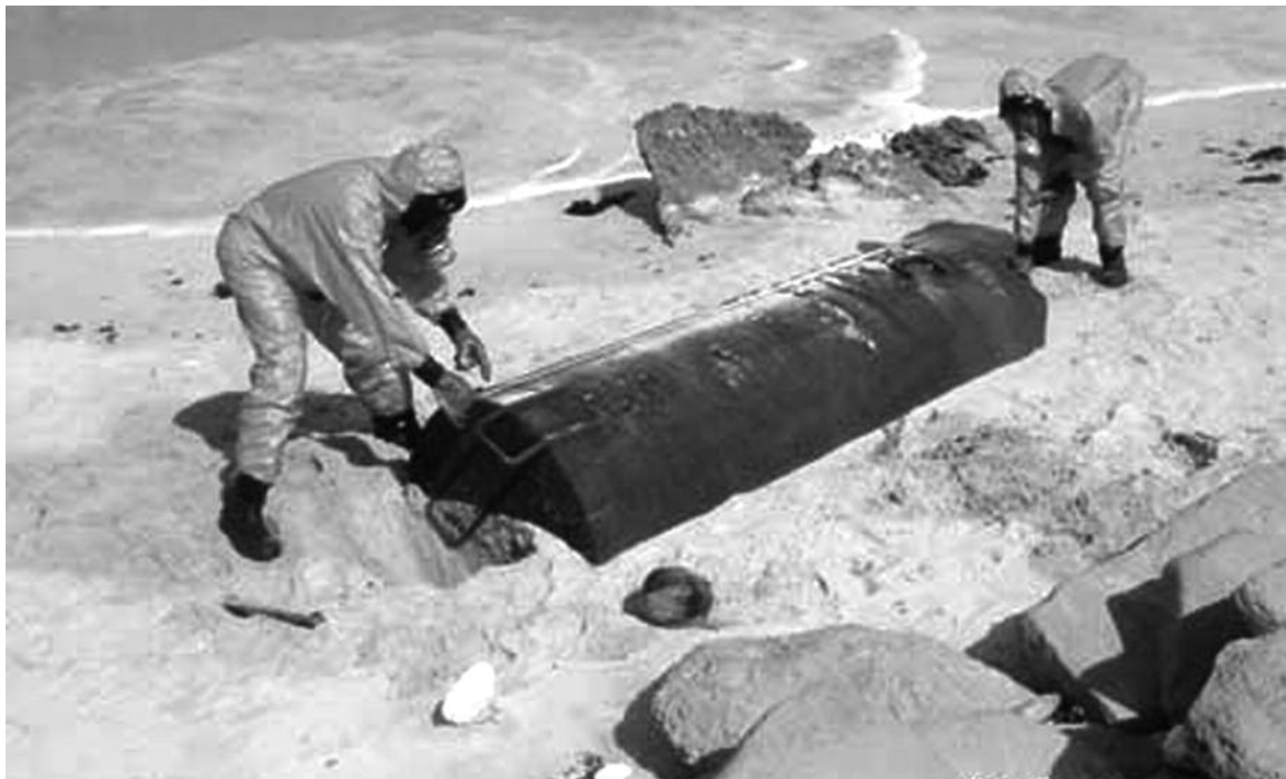
Nach Zeugenaussagen waren europäische Regierungen und die Mafia an den Giftmüll-Geschäften beteiligt.

hiervon noch zehn Kilometer landeinwärts zu spüren waren. Wieder einmal gaben die alarmierten Vereinten Nationen eine Warnung aus.