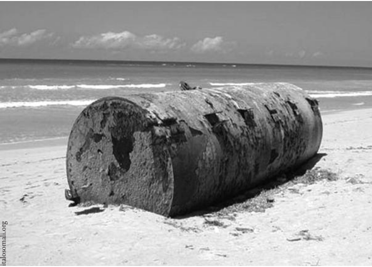
Giftmülltonne, vom Tsunami ans Licht gebracht