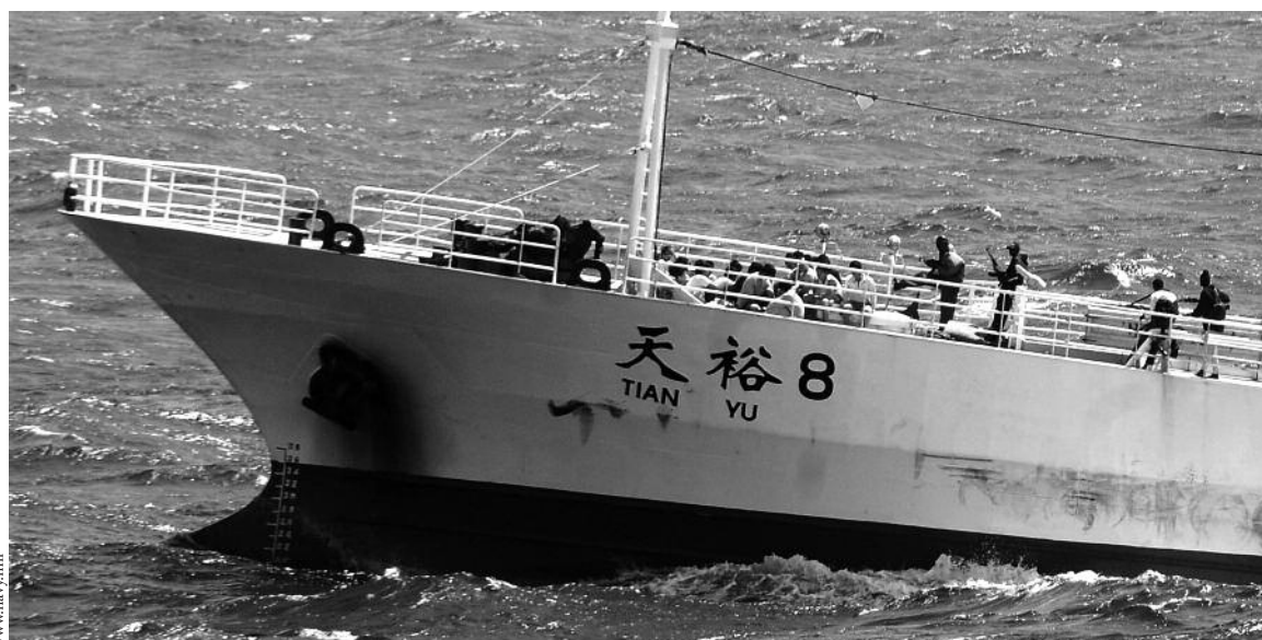
17. November 2008: Piraten halten die Mannschaft des chinesischen Fischtrawlers Tianyu-8 gefangen.

Übersetzung aus dem Englischen: Philipp Reuter